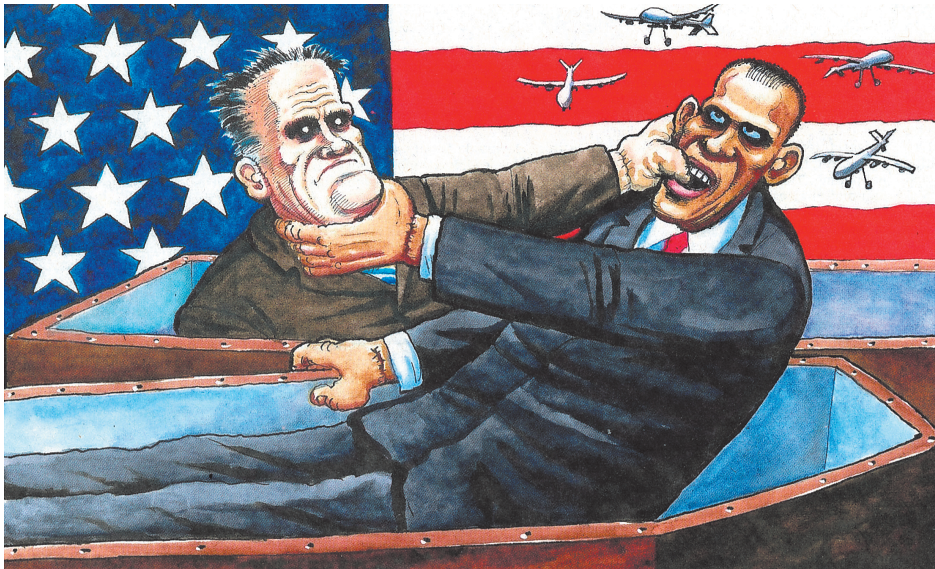
Του STEVE BELL από την GUARDIAN

* Ομότιμος καθηγητής Διεθνούς Δικαίου στο Πανεπιστήμιο του Πρίνστον, επισκέπτης καθηγητής Παγκόσμιας Πολιτικής στο Πανεπιστήμιο της Καλιφόρνιας στη Σάντα Μπάρμπαρα και ειδικός εισηγητής του ΟΗΕ για την κατάσταση των ανθρωπίνων δικαιωμάτων στα Κατεχόμενα Παλαιστινιακά Εδάφη.